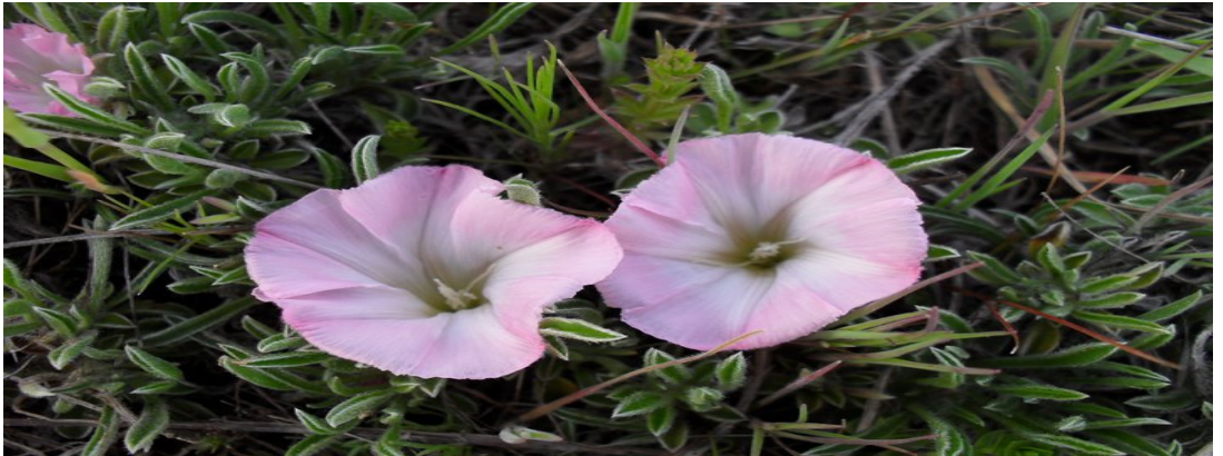
Resim 2 Çoban Çiçeğinden Bir Görünüm

Serinyayla köyü yerleşim bakımından boz dede dağı ve kuşaklı tepenin eteklerine ve bu dağlar arasındaki çukur alanlara yerleşmiştir. Yine arazi dağlık ve