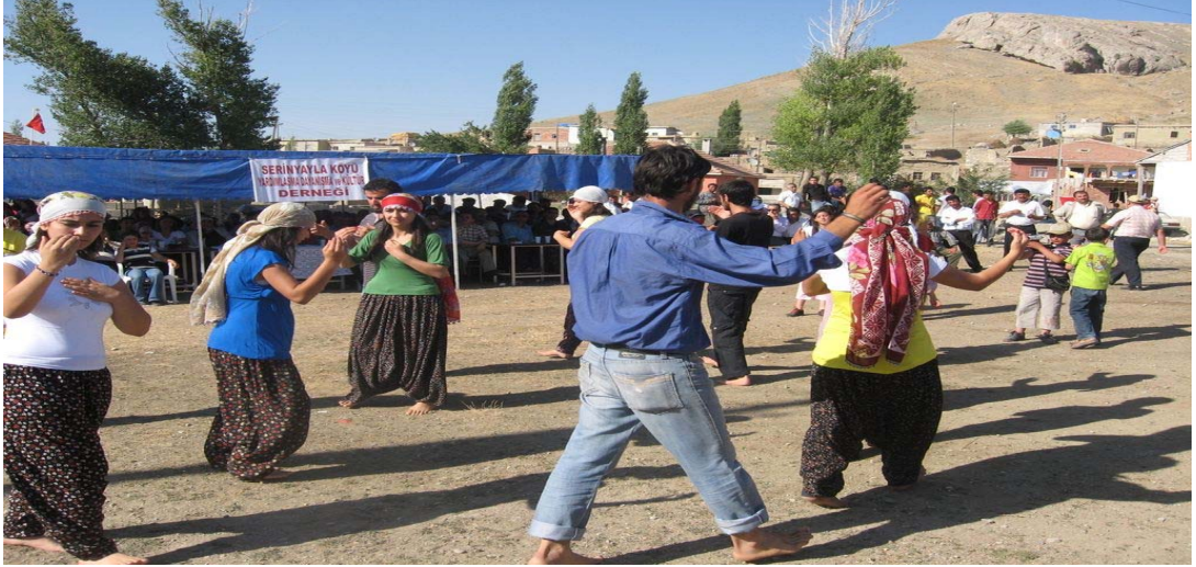
Resim 11 Köydeki Davullu Şenliğinde Semah Dönen Gençlerden Görünüm/ Foto: İsmail Özer- 2008

Serinyayla köyünde önceleri kız alış verişleri ya da kız-erkek evlendirmeleri eskiden köy içinde ve dışarı alevi köyleriyle alış-veriş vardı. Belli bir zaman sonra genellikle kentlere göçen kişilerin bu konudaki tavrı değişerek Alevi – Sünni kız alış verişleri de olmuştur. Ayrıca değişen bir zamanda kentlerdeki kız alış verişleri köylere de yansımış ve köylerdeki insanlarda sunilerden kız alıp vermeye basılmıştır. Baktığımızda köyün en çok alış verişi kız vermeleri olmuş kız almaları ise çok nadir durumda olmuştur. Son yıllarda bu durumu artık gençler görmezden gelmiş ve arkadaşlıklarında ve evlenmelerinde bu durumu görmezden gelmişleridir. Yani geleneksel yapıyı zorlayarak bu durumu aşmıştır. 122