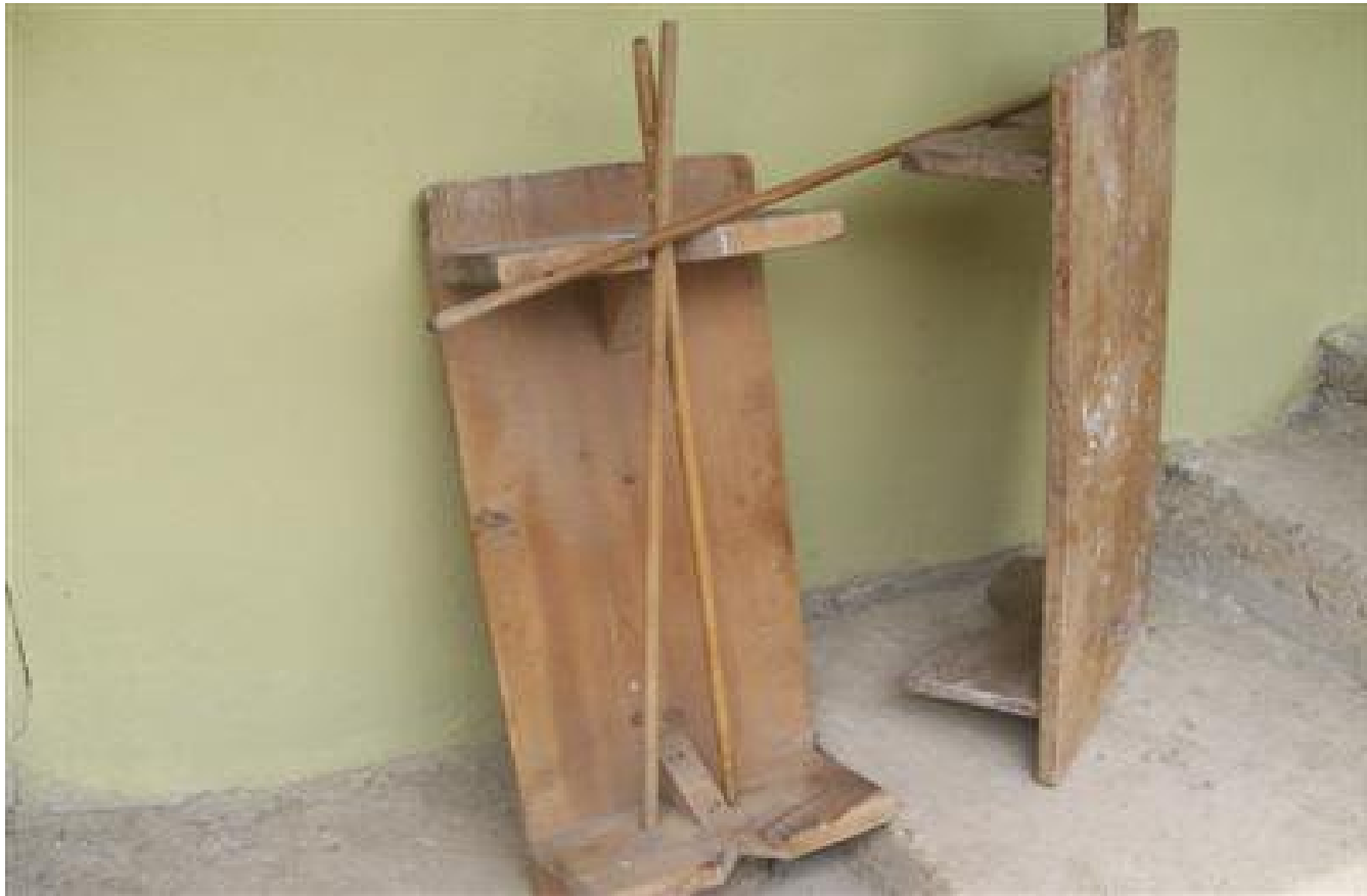
Resim 15 Köyde Kullanılan Araçlardan Okla ve Ekmek Yapma Masasından Görünüm