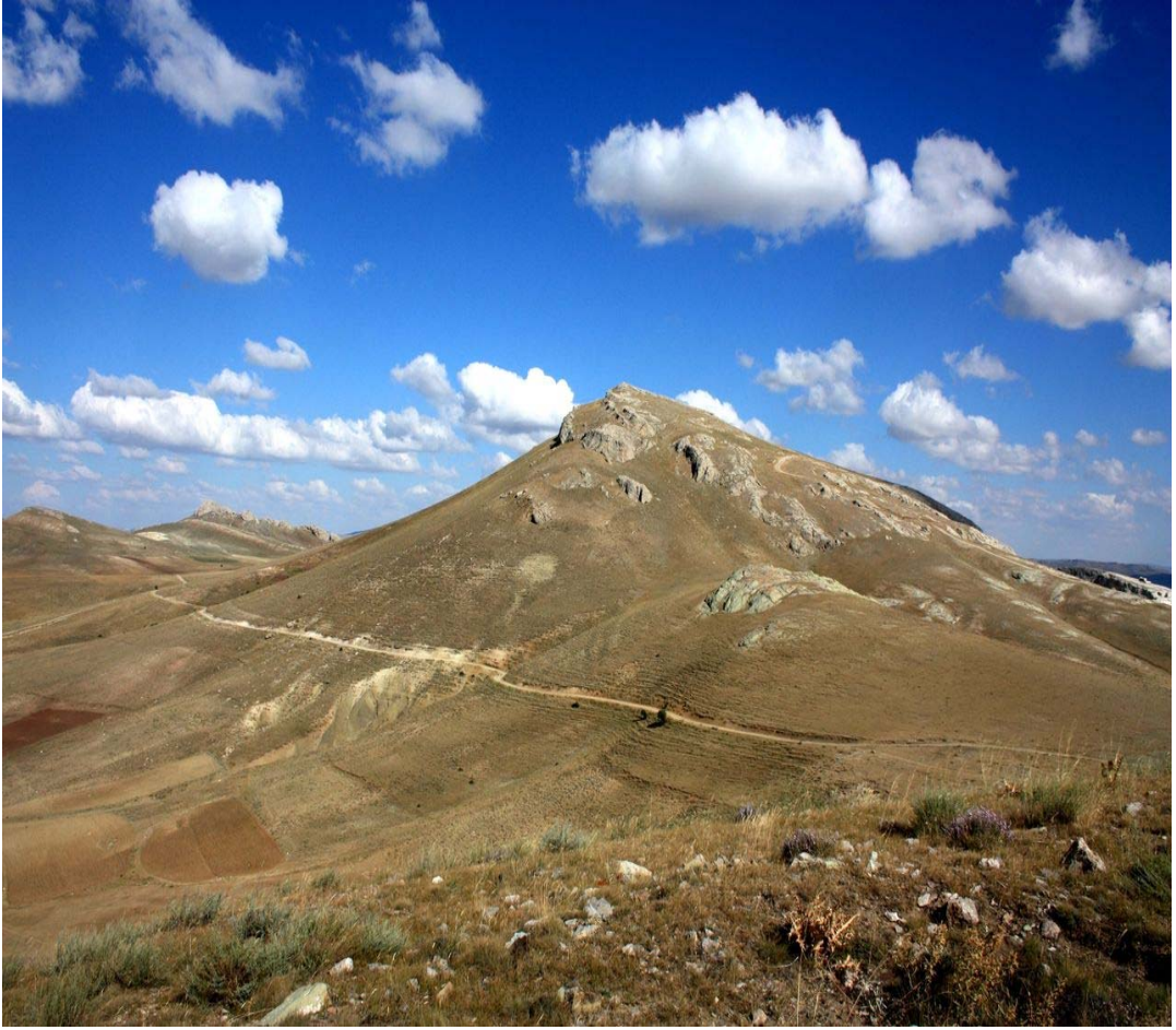
Resim 22 Köyün Yaylalarından Görünüm