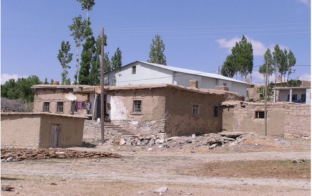
Resim 18 Köyün Eski Yapılarından Bir Görünüm/ Foto: İsmail Özer - 2010

Serinyayla bir kayalıklar arsında ve dağın eteğinde yer almasına rağmen zor şartlar olsa da son yıllarda kerpiç evlerin yerini betonarme evler almıştır. Eski evlerin yapı malzemesi genelde topraktan yapılan kerpiç, ağaç ve çalıdır. Şimdi ise bu tip evlerin yerini artık betonarme evler yer almıştır. Evler müstakil bir ev görünümündedir; son yıllarda kanalizasyon alt yapılarının olmasıyla tuvalet ve lavoba evin içindedir oysa eskiden evin dışındaydı şimdi ise evin içindedir genellikle