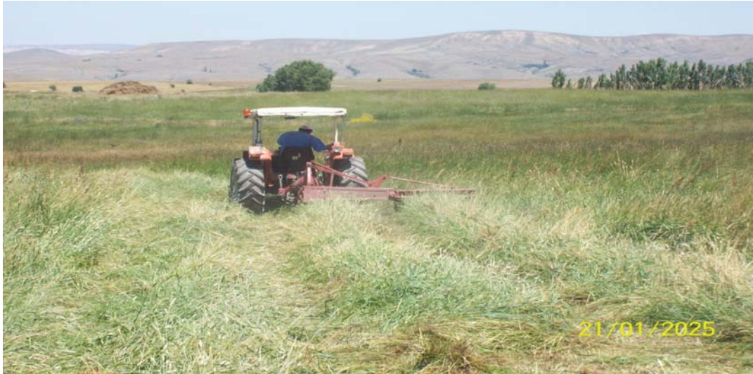
Resim 11 Çayır Biçen Bir Çiftçiden Bir Görünüm/ Foto: Kemal Bal-2010

Sebze ve meyve üretiminde eskilere baktığımızda kusuyurt, musurat ve dar deresi önemli bir meyve üretimi ve sebze üretimi yapılmaktadır. Serinyayla köyünün en kötü dramı olan göçün sonuçlarından bu yerler zamanla devam ettirememiş ve kendi haline bırakılarak verimsizleştirilmiştir. Gerekli sulamanın yapılmaması ve bakımdan yana ilgilenilmemesinden dolayı bu yerler maalesef eskisi gibi üretim sağlamamaktadır. Baktığımız zaman ilerleyen yıllara göre insanların toprakla doğal