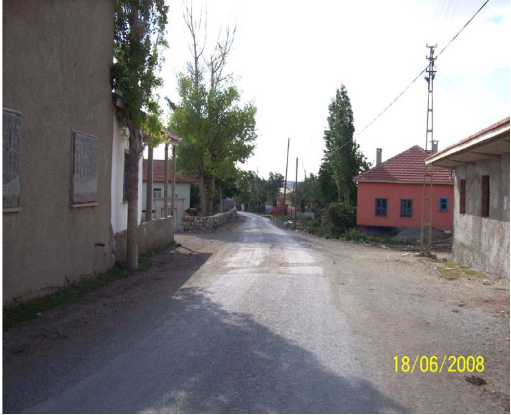
Resim 29 Köyün Aşağı Yöne Giden İkinci Meydandan Görünüm