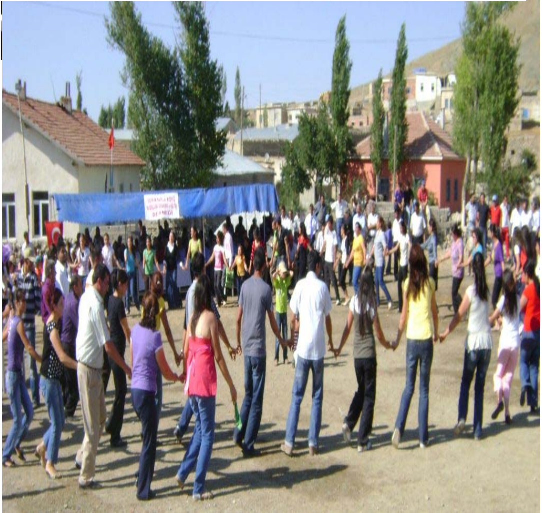
Resim 41 Serinyayla Köyünün Davullu Şenliğinde Oynanan Halaydan Bir Görünüm