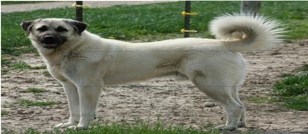
Resim 8 kangal köpeğinden görünüm