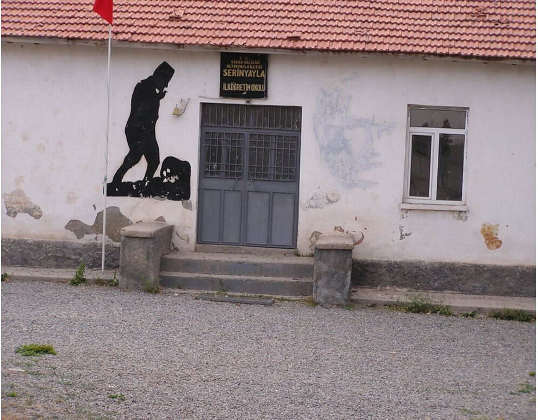
Resim 24 Köyün İlkokulundan Bir Görünüm/ Foto: Kemal Bal-2010