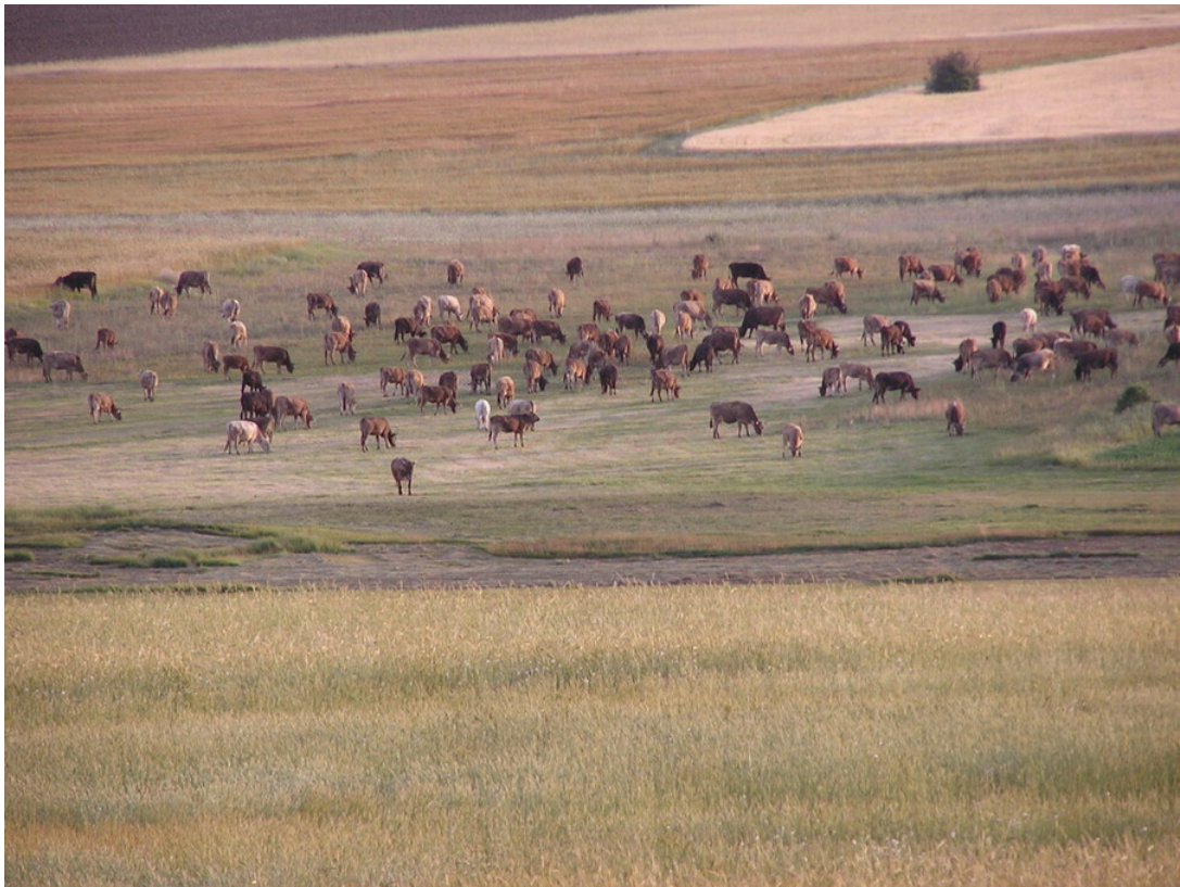
Resim 9 Büyükbaş Hayvanlardan Bir Görünüm