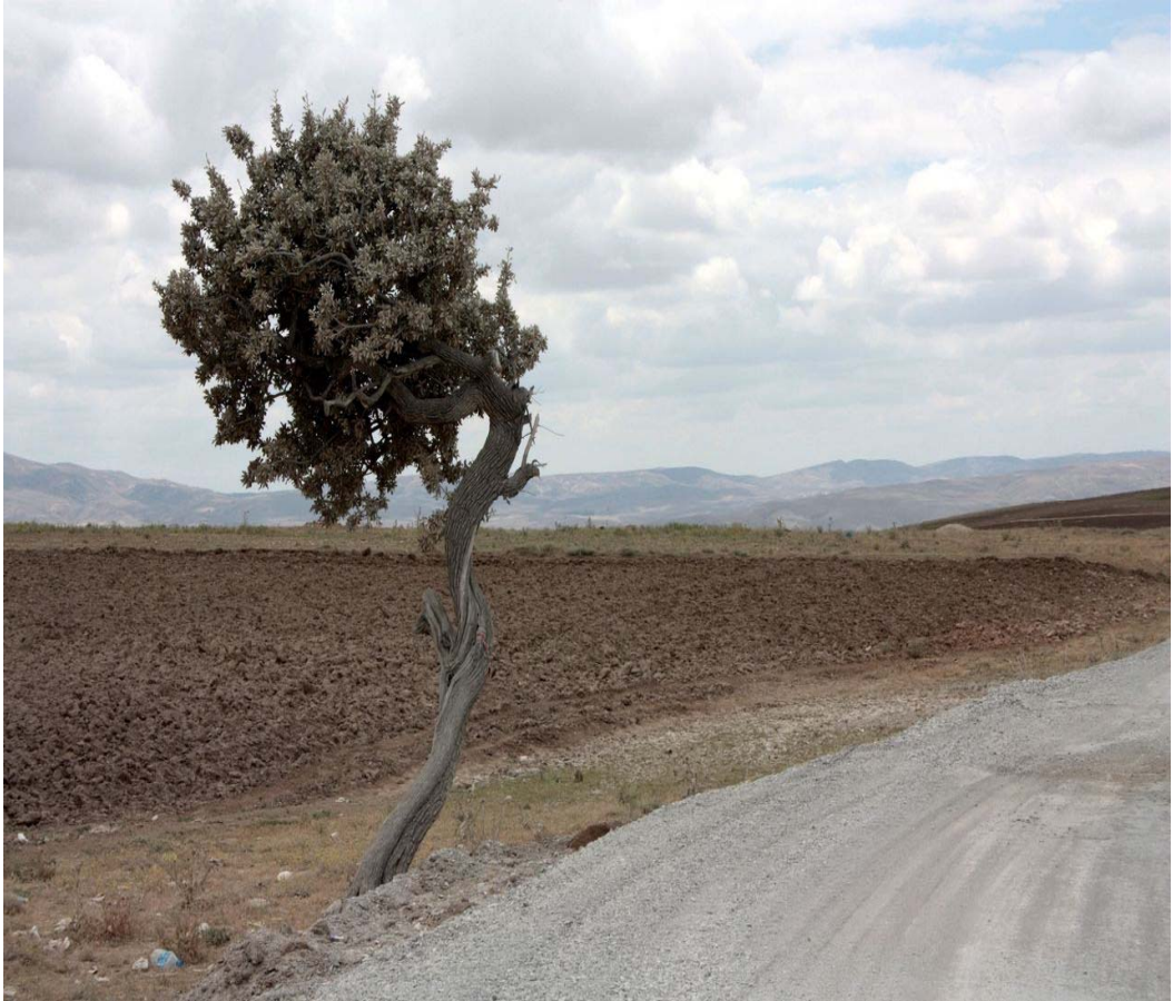
Resim 24 Tek Armut'tan ( Eskiden Dilek Ağacı Olarak Kullanılırdı ) Görünüm