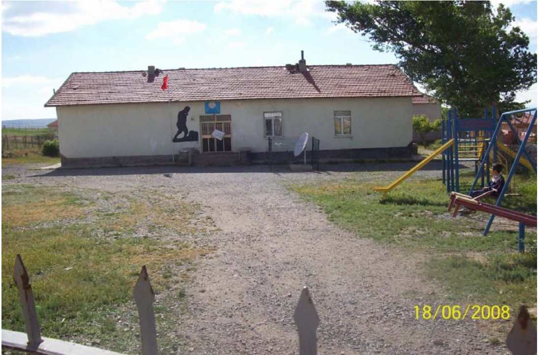
Resim 10 Serinyayla Okulundan Görünüm / Foto: Kemal Bal - 2008

Serinyayla köyünde eğitimin son yıllara baktığımızda düşüş olduğunu bunun da en önemli nedeni ise ekonomik neden olduğu, eğitimin parasallaştığı ve çevreden kaynaklan etkiler olduğu görülmektedir. 26