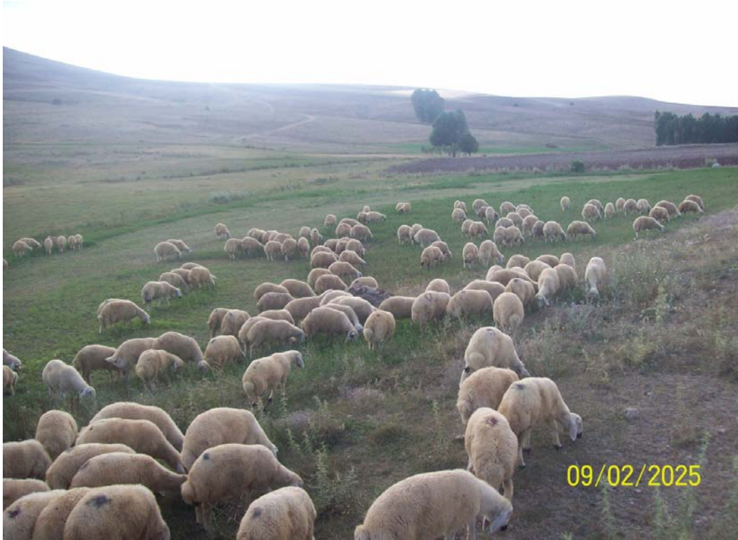
Resim 16 Küçükbaş Hayvanlardan Bir Görünüm/ Foto: Kemal Bal-2010