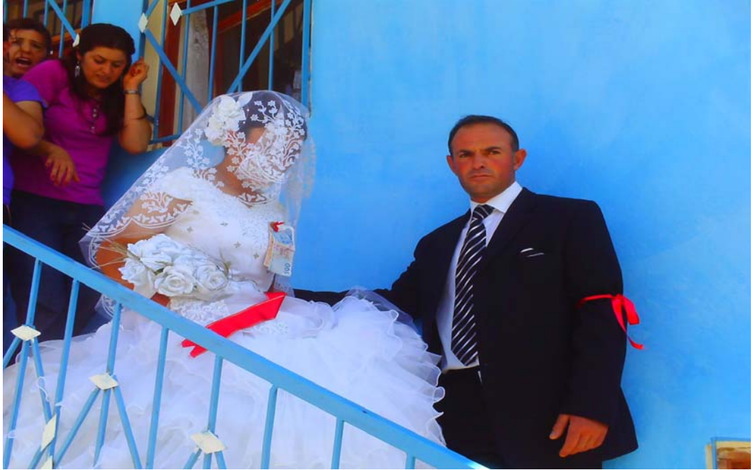
Resim 27 Köydeki Düğünde Gelin ve Damattan Bir Görünüm/ Foto: Murtaza Coşkun - 2009

Dikkat çeken bir diğer şey ise düğün kâhyalarında mehter tarafından üç vakit nevbet ( nöbet ) çaldırılmasıdır.