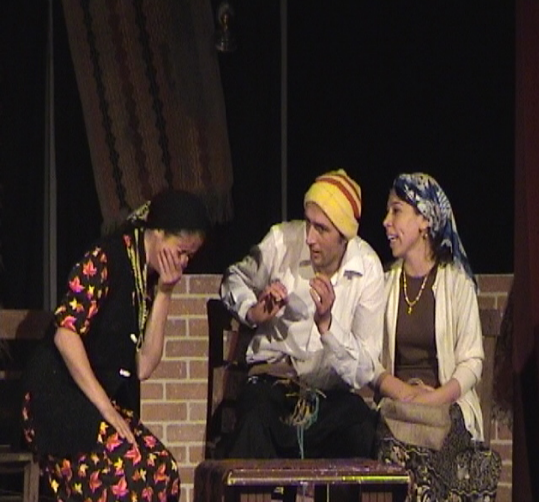
Resim 46 SEY-DER'in Düzenlediği Tiyatro Gösterisinden Bir Görünüm