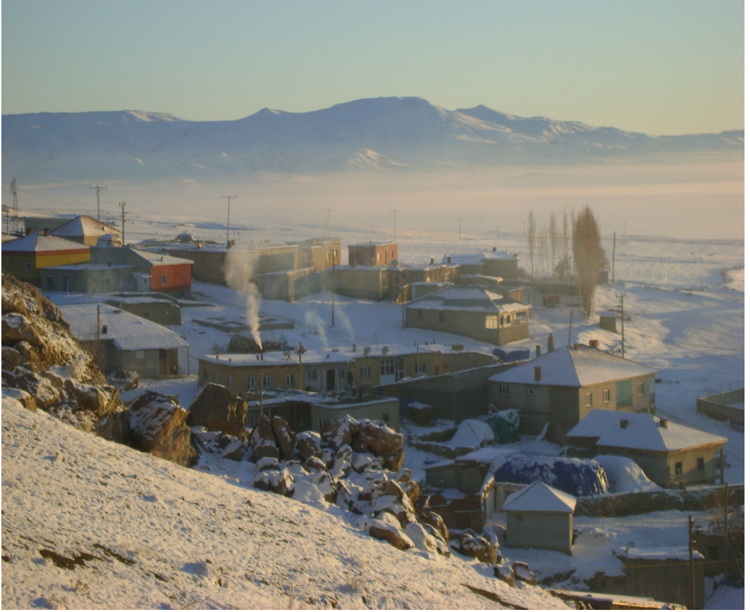
Resim 9 Serinyayla Köyü'nün Kış Mevsiminden bir görünüm/ Foto: Murtaza Coşkun-2009

iç Anadolu iklim özellikleri yaşanmaktadır. Karasal iklim hakimdir. Yazlar çok sıcak ve kurak geçer. Gece ile gündüz arasındaki sıcaklık farkı belirgin olarak hissedilir. Kış oldukça uzun sürmektedir. Hava Sıcaklığı kışın sıfırın altına düşmektedir. Köyün iklimi, karasal iklimi etki alanı içerisindedir. 22