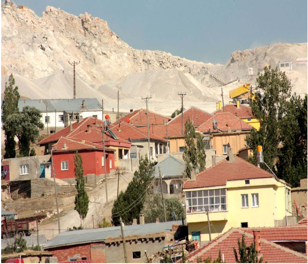
Resim 32 Konutların Engbeli Bir Arazideki Görünümü