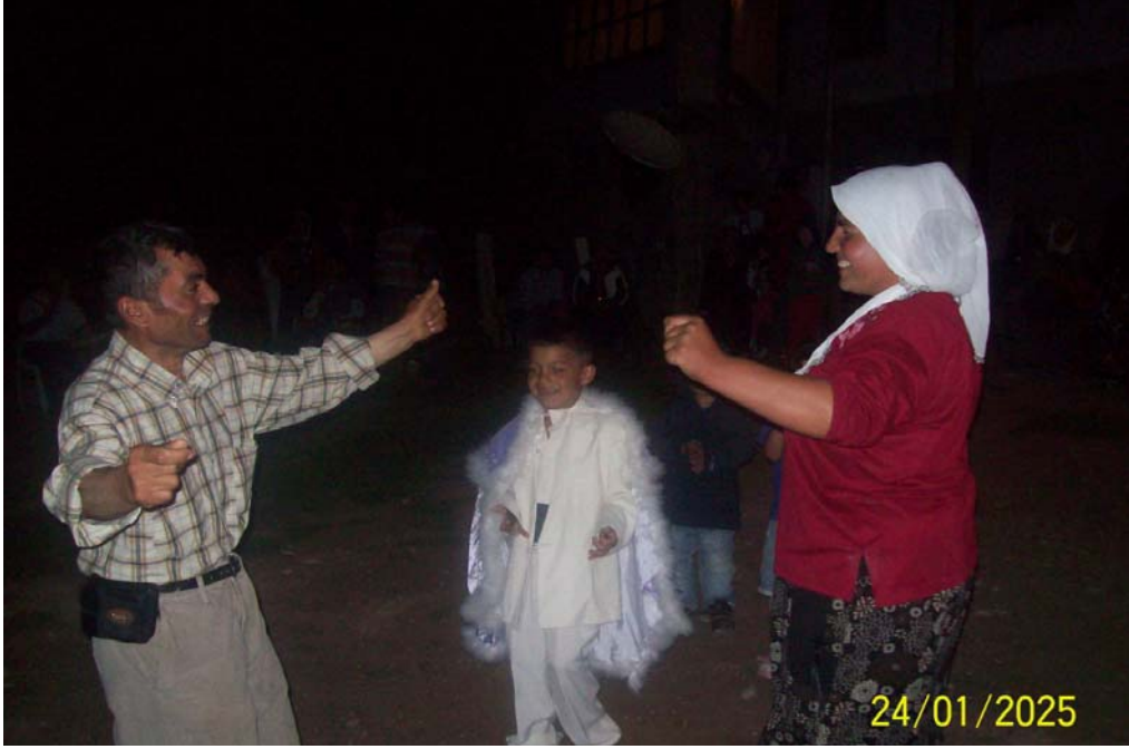
Resim 29 Sünnet Töreninden Bir Görünüm