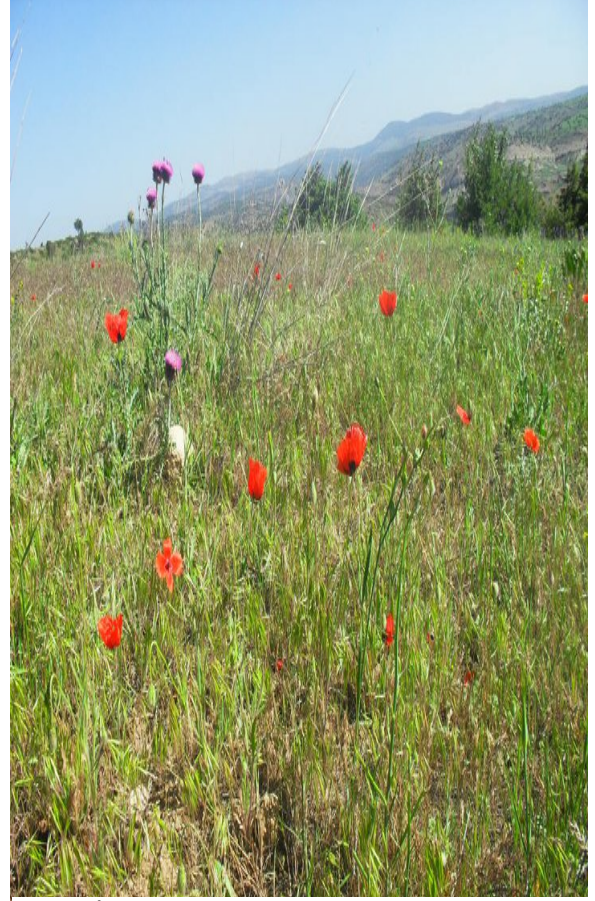
Resim 3 İt Dirseği Çiçeği/ Foto: Veysel Taştan- 2009

Bölge ormanlık olmamasına karşın birçok yaban hayvanını barındırmaktadır. Bunlar: Kuşları; Şahin, kartal(hel), atmaca, karga, kırlangıç, serçe, sığırcık, sülün,