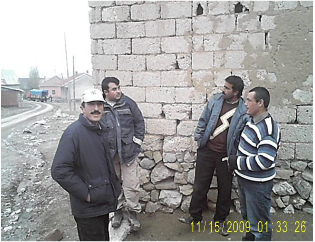
Resim 20 İstihdam Yetersizliği Mağduru Olan Gençlerden Görünüm/ Foto: Murtaza Coşkun - 2009