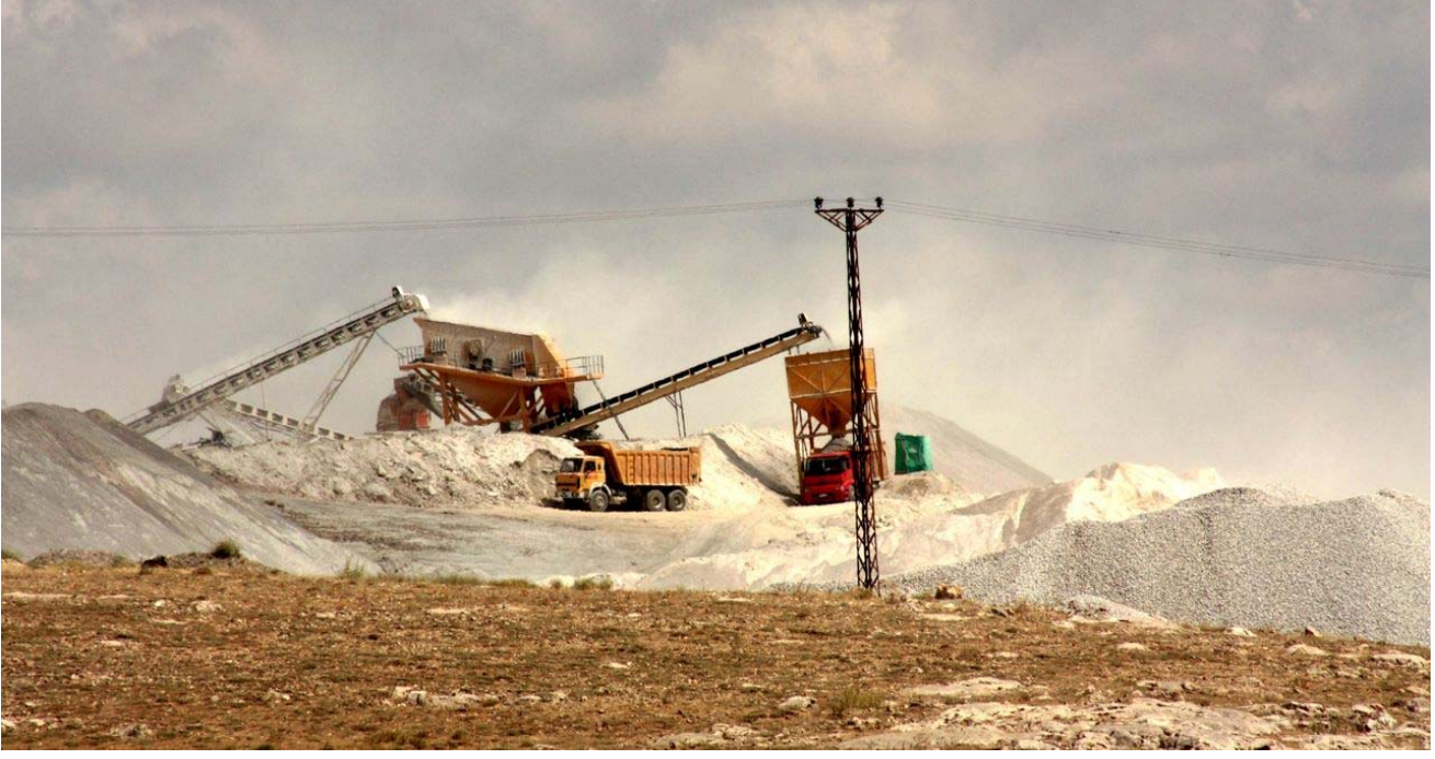
Resim 19 Köyün Çok Sıkıntı Çektiği Taş Ocağı İşletmeciliğinden Görünüm