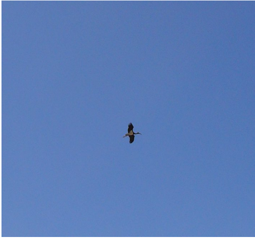
Resim 7 Serinyayla Köyündeki Yabani Kuş Olan Leylekten Bir Görünüm

Domuz sayısı son yıllarda artış göstererek köylüyü zor duruma sokmuştur. Tarım alanlarına önemli ölçüde zarar vermektedir. Kurt sayısının fazla olması ise çobanları ve sürü sahiplerini zor duruma sokmuştur.