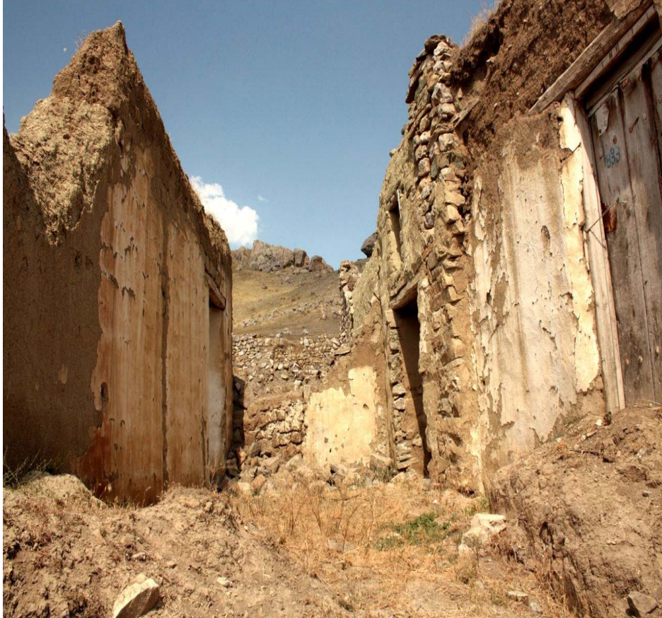
Resim 33 Yıkılmış Toprak Evden Bir Görünüm/ Foto : İsmail Özer - 2009

Serinyayla Köyünün ana geçim kaynağı tarım ve hayvancılık olduğu gibi bunun yanında köylü için toprak mülkiyeti önemli olup ve köyün büyük bir çoğunluğunun toprağı olup ama yetersizdir. Köyde önceleri yaygın olan hayvancılık ve tarım olduğu için köylünün çoğuna arazisi yeterli gelmemekte hayvanlarının yem ihtiyacını karşılamak için ya komşusundan parayla yem almakta ya da komşu köylerden yem almaktadır. Son yıllarda baktığımız da ülkede uygulanan ekonomik politikalar hem köylüyü perişan etmiş hem hayvancılık ve tarımla ilgileneni perişan etmiş köylü toprağını ekemez ve hayvancılık yapamaz duruma gelmiştir. Köylünün yapılan araştırmada arazi sahipliğine baktığımızda % 82.7 sahip olduğu diğer % 17.3 ise toprağını kiraya verdiği ya da toprağının olmadığı tespit edilmiştir. 87