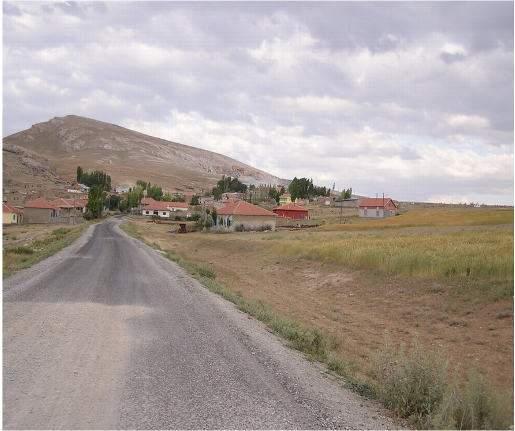
Resim 28 Köyün Girişinden ve Köyün Manzarasından Görünüm