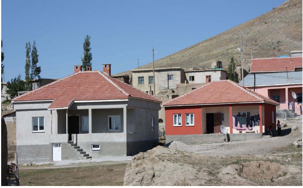
Resim 31 Son Yıllardaki Modern Evlerden Bir Görünüm/ Foto: İsmail Özer-2010