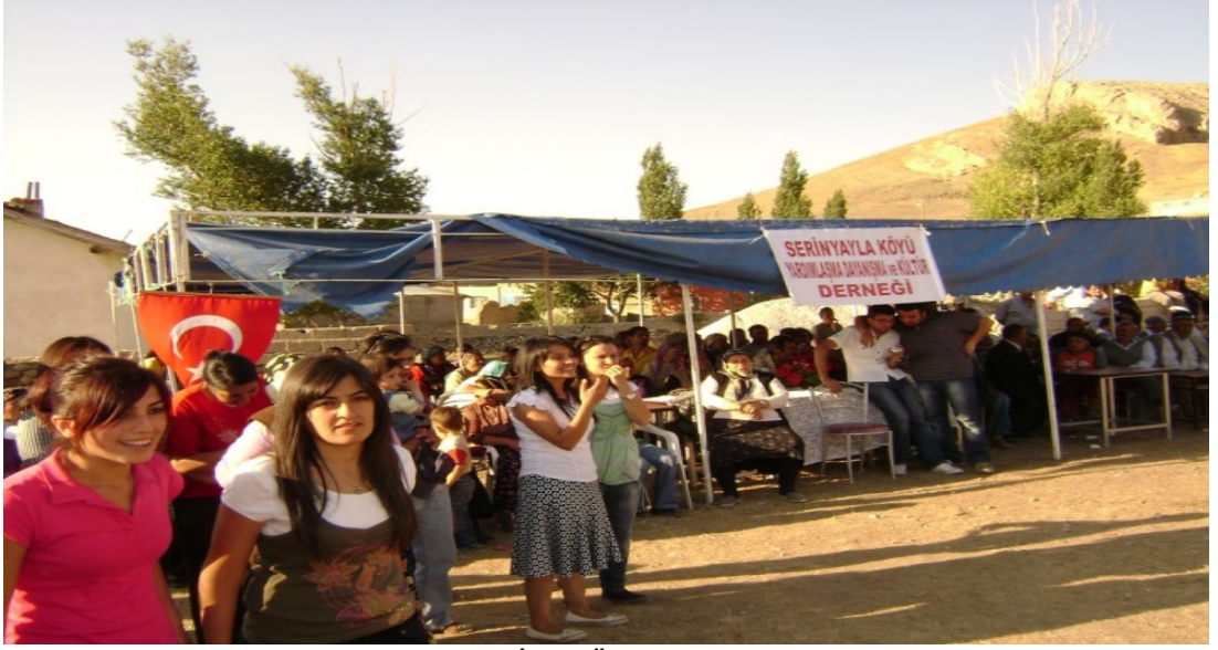
Resim 42 Davullu Şenliğinden Görünüm/ Foto: İsmail Özer - 2008