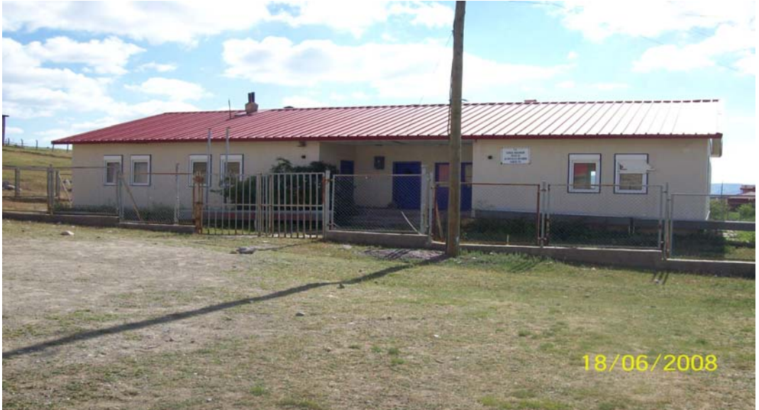
Resim 25 Köyün Sağlık Ocağından Bir Görünüm

Serinyayla köyü sağlık alanında ilerleme olmuştur. Köyün sağlık evine sahip olması sadece 1 yıl sürmüş sonradan ise devletin uyguladığı politikalar eşliğinde sağlık ocağında görevli resmi olmamış ve yaklaşık 3- 4 yıl boş kalmış ve sonraları ise devlet tarafından tıbbi eşyalarında taşınmasından sona sağlık evi lojman olarak kullanılmaktadır. 46