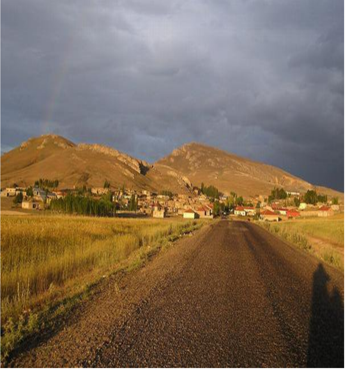
Resim 1 Serinyayla Köyü Girişinden Bir Görünüm/ Foto: İsmail Özer - 2008