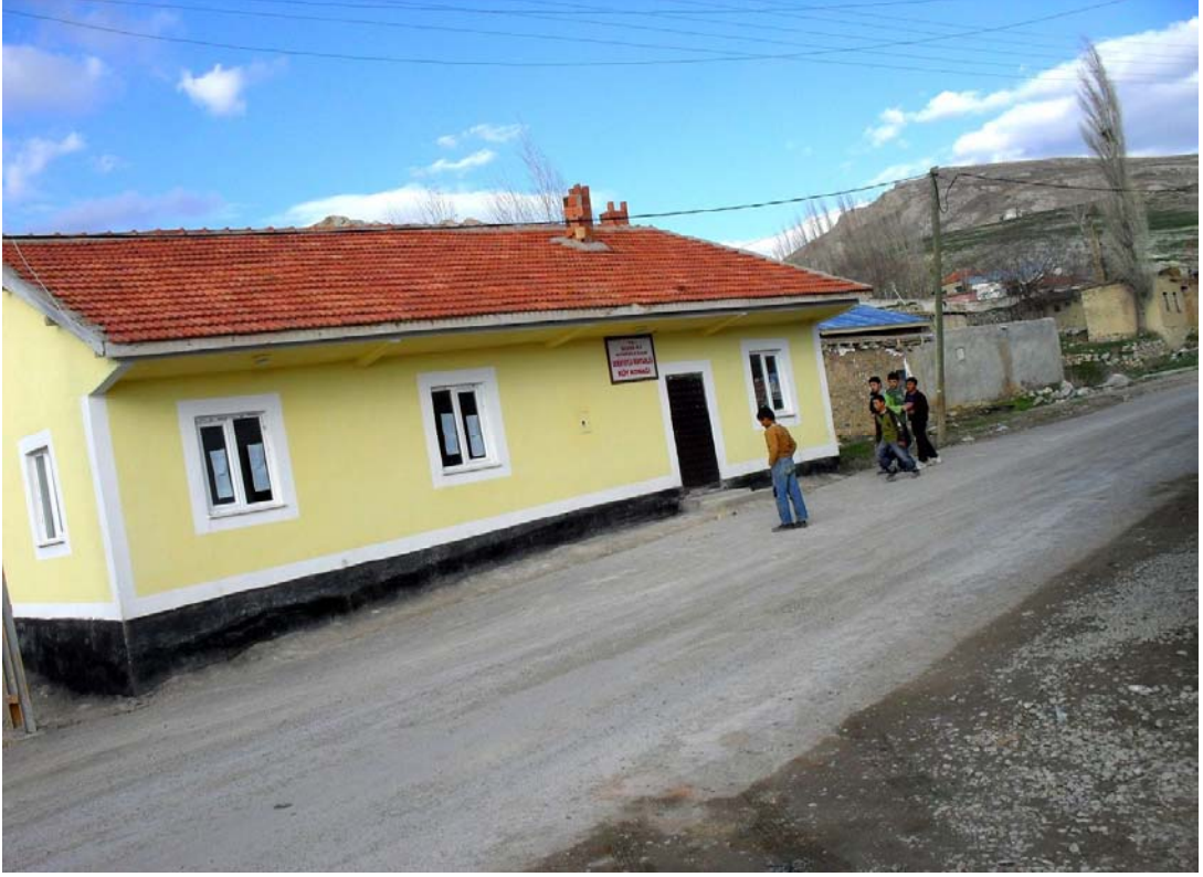
Resim 23 Köyün Yeni Köy Odasından Görünüm/ Foto: Veysel Taştan-2011