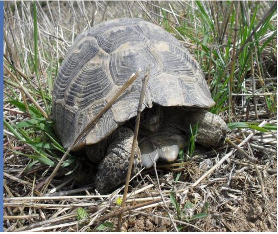
Resim 6 Kaplumbağa