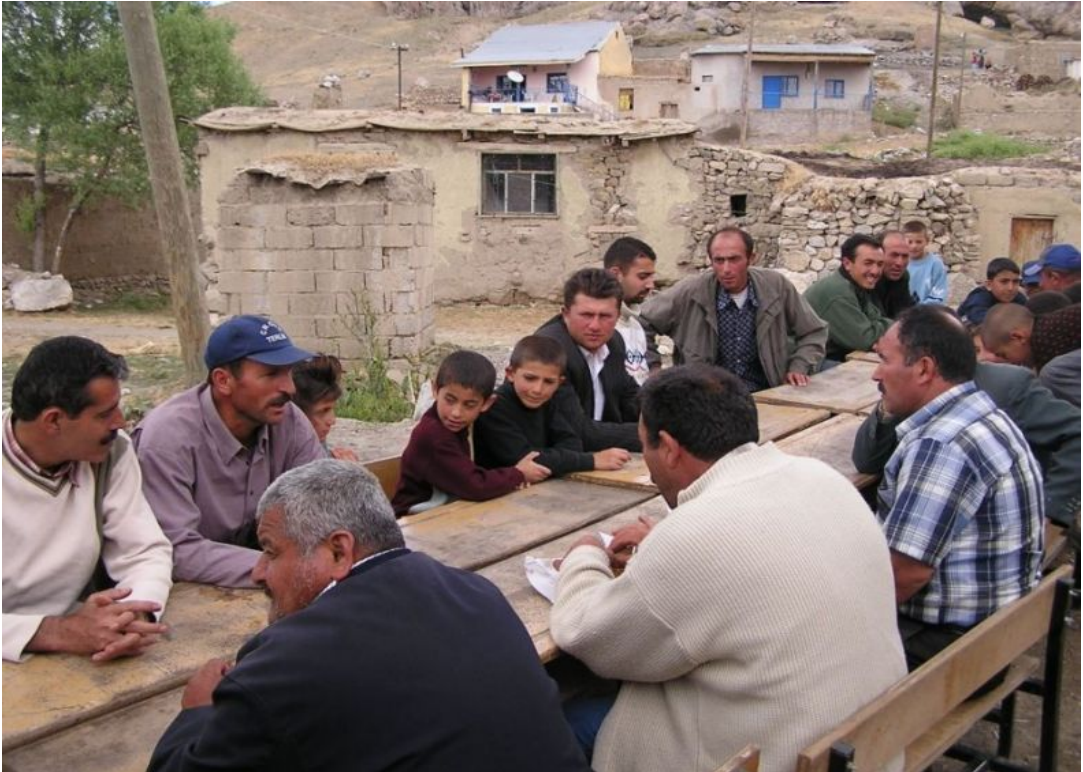
-Resim 30 Can Yemeğinden Bir Görünüm - 2008

Mezar kaldırma işi ise yaklaşık bir yıl sonra yapılır. Bu beklemede ki amaç ise mezarın oturması ve toprağın yerleşmesidir. 76