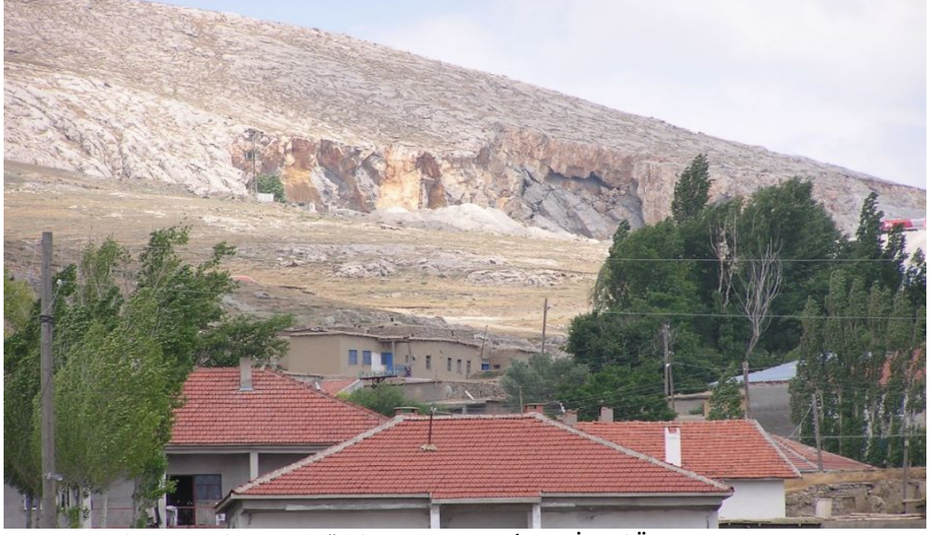
Resim 21 Köyün Büyük Sorunu Olan Taş Ocağından Bir Görünüm/ Foto: İsmail Özer - 2008