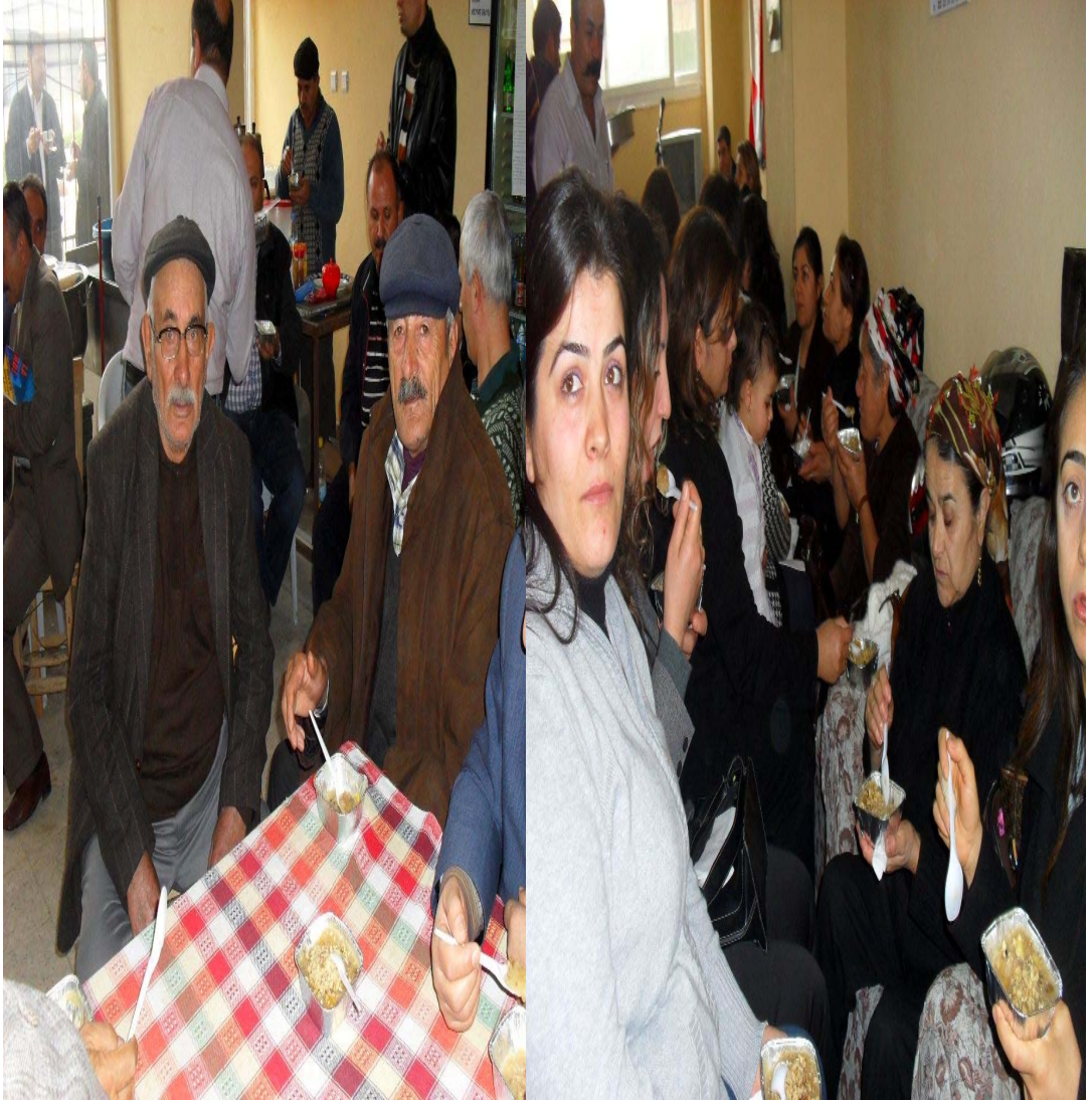
Resim 12 Aşure Gününden Bir Görünüm/ Foto: İsmail Özer- 2008