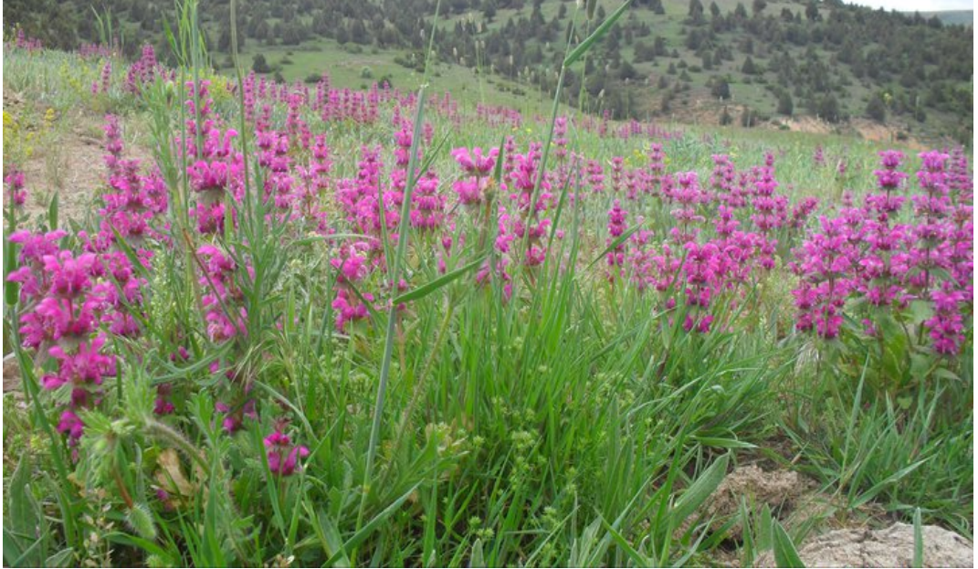
Resim 5 Bahar Aylarındaki Doğadan Bir Görünüm/ Foto: Veysel Taştan - 2009

Bölge ormanlık olmamasına karşın birçok yaban hayvanını barındırmaktadır. Bunlar: Kuşları; Şahin, kartal(hel), atmaca, karga, kırlangıç, serçe, sığırcık, sülün,