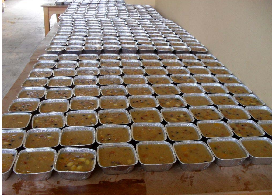
Resim 38 Serinyayla Derneğinin Aşurelerinden Görünüm/ Foto: Veyssel Taştan - 2010

Geleneksel Davullu Şenlikleri, çeşitli gün ve bayramlar da toplu yemekler, aşure günü, aşure yapımı ve dağıtımı, tiyatro oyunları, öğrencilere ve diğer alanlarda verilen kurslar ve eğitim vs. ayrıca düğün ve cenazelerde sandalye masa vb organizasyonlar ya da son yıllarda can yemeği gibi yemeklerde derneğin bir takım işlevleri görülmektedir. 133