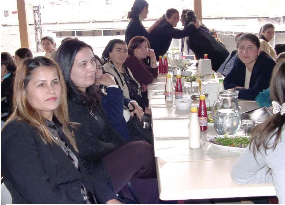
Resim 47 SEY-DER'in Düzenlediği Kadınlar Günü Özel Yemeğinden Bir Görünüm/ Foto: İsmail Özer -2008