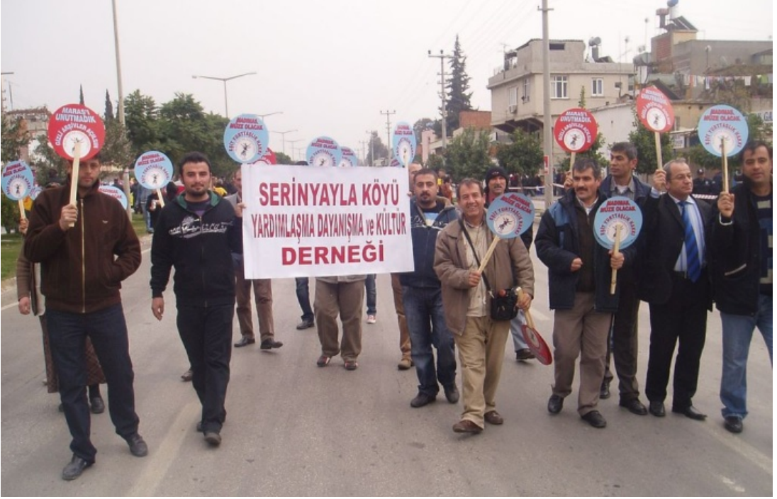
Resim 45 Maraş Katliamını Kınamak İçin Eyleme Katılan Sey-Der'den Görünüm/ Foto: İsmail Özer- 2008