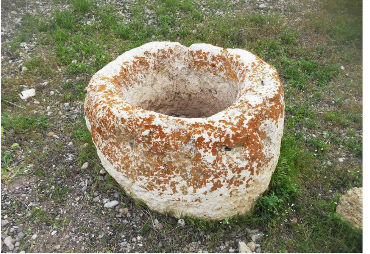
Resim 13 Eski Bir Tokmak Taşından Bir Görünüm