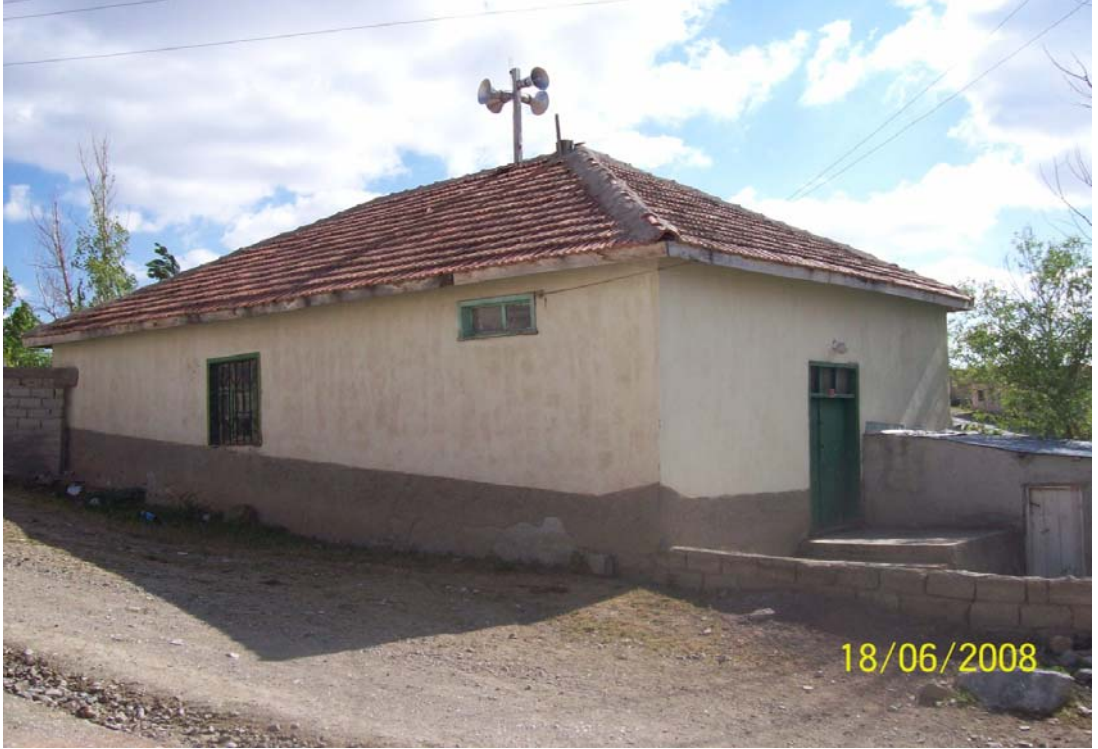
Resim 26 Köyün Camisinden Bir Görünüm/ Foto: Kemal Bal-2008

Serinyayla köyünde cami Turgut Özal döneminde yapılmıştır. Köyün önde gelenleri ve köy öğretmenin etkisiyle yapılan cami köyde çok önemsenmemekte olup ve köy halkı da çok kullanmaktadır. Köy özellikle camiyi bayram namazlarında ve Cuma namazlarında kullanmaktadır, diğer günlerde ise cami çok kullanılmaktadır. Köydeki algıya baktığımızda köyde caminin yapılması gündeme gelmiştir ancak bir sonuç alınamamıştır. Hatta caminin yıkılıp yerine caminin yapılması bile gündeme gelmiş fakat belli çevreler buna tepki göstermiştir. 47