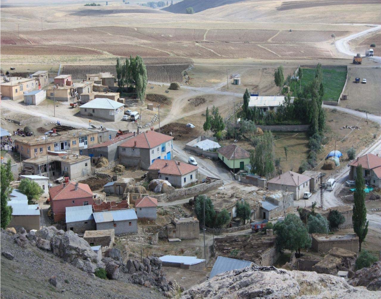
Resim 18 Köyün Orta Kesimde Kalan Yerleşiminden Görünüm