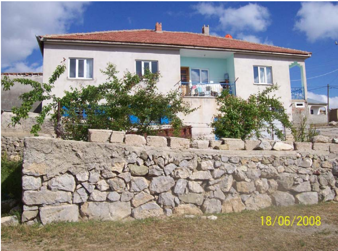
Resim 19 Köyün Modern Evlerinden Bir Görünüm

Köyün yıllardır ve daha önceleri de sıkıntılarının başında şüphesiz su sıkıntısı oluşturmaktadır. Köyün halkı bu durumda çok zor durumlar yaşamaktadır. bu sıkıntının giderilmesi için bir çok proje yapıldıysa da yeterli bir sonuç alınamadı. Su sıkıntısının kit olması ve köye özellikle yetersiz gelmesi su kaynaklarının yetersiz olması ve düzensiz kullanılmasıdır. Köyün su kaynaklarının seyrek olması ayrıca köyde birçok israf olarak kullanılması bu kaynaklarının yetersizliğinin de bir sebebidir. Bu konuda özellikle yaz aylarında gelen Serinyayla halkının yani dışarı illerden gelenlerin çok şikâyetçi olduğu görülmektedir. Bu sorun köylülerden aldığımız bilgilere göre kış aylarında sorun olmamaktadır sadece yaz mevsimine has bir sıkıntı olup köyün bu sıkıntıdan çok yakındığı görülmektedir. Birkaç köylüye