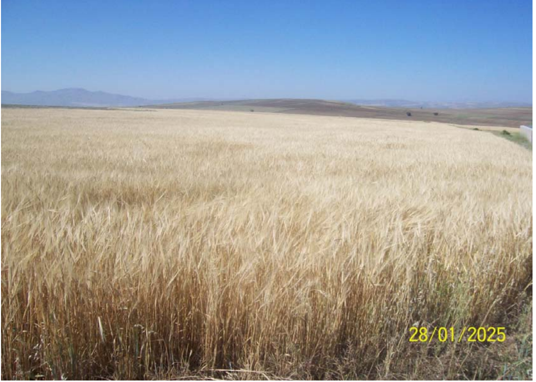
Resim 12 Biçime Gelmiş Arpa Tarlasından Bir Görünüm/ Foto: Kemal Bal -2011