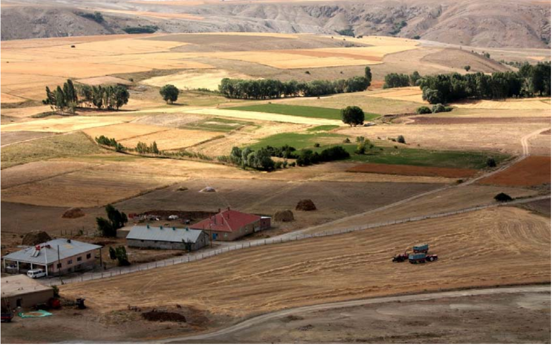
Resim 23 Köyün Altındaki Araziden Görünüm