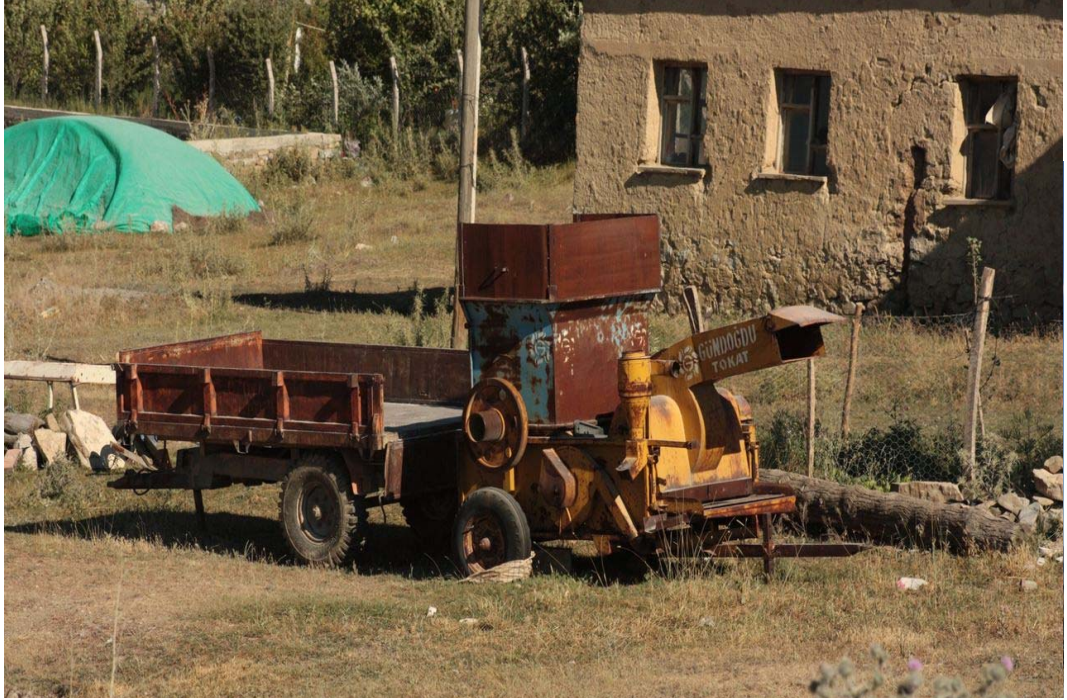
Resim 10 Kullanılan Tarım Makinelerden Görünüm/ Foto: İsmail Özer- 2008

Evlerin iç düzenleri, işlevsel olmasa da kent evlerine benzemektedir.