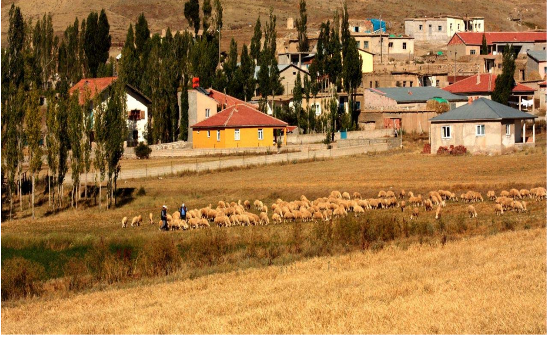
Resim 21 Köyün Girişinden Görünüm