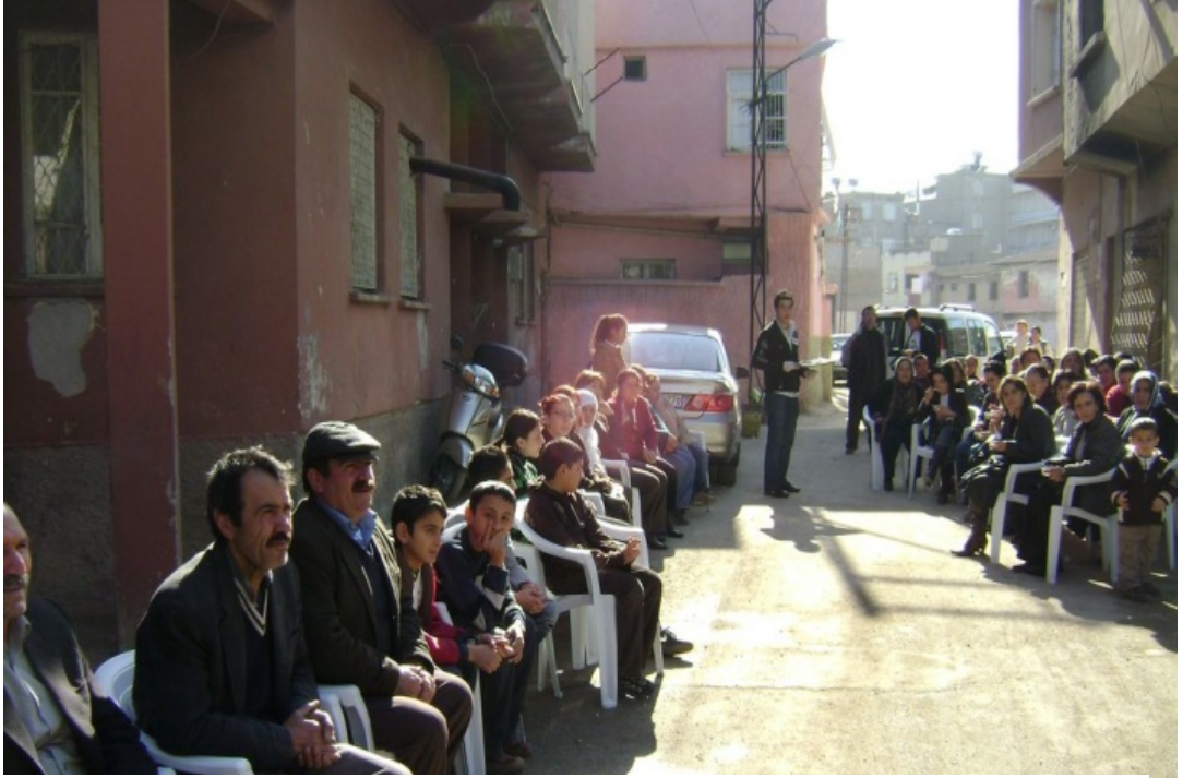
Resim 40 Derneğin Düzenlediği Aşure Gününe Katılan Köylülerden Görünüm/Foto: İsmail Özer- 2008