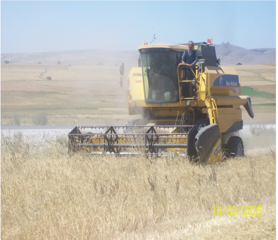
Resim 7 Çiftçinin Biçerdöver İle Tarlasını Biçtirirken