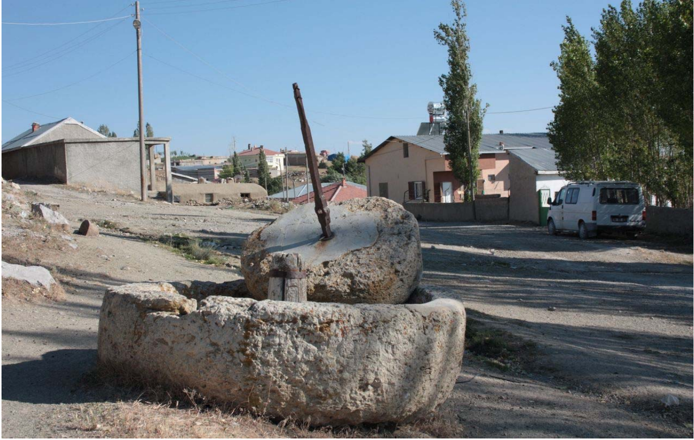
Resim 16 Hayvan Gücüyle Kullanılan Eski ve Büyük Bir Tokmak Taşından Görünüm