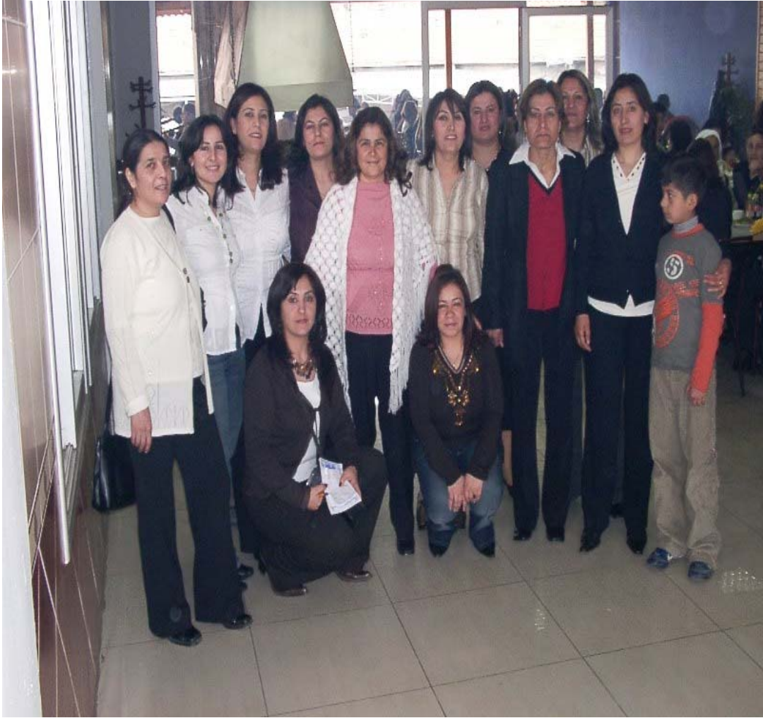
Resim 48 SEY-DER Kadın Kolu Yönetiminden Bir Görünüm/ Foto: İsmail Özer - 2008