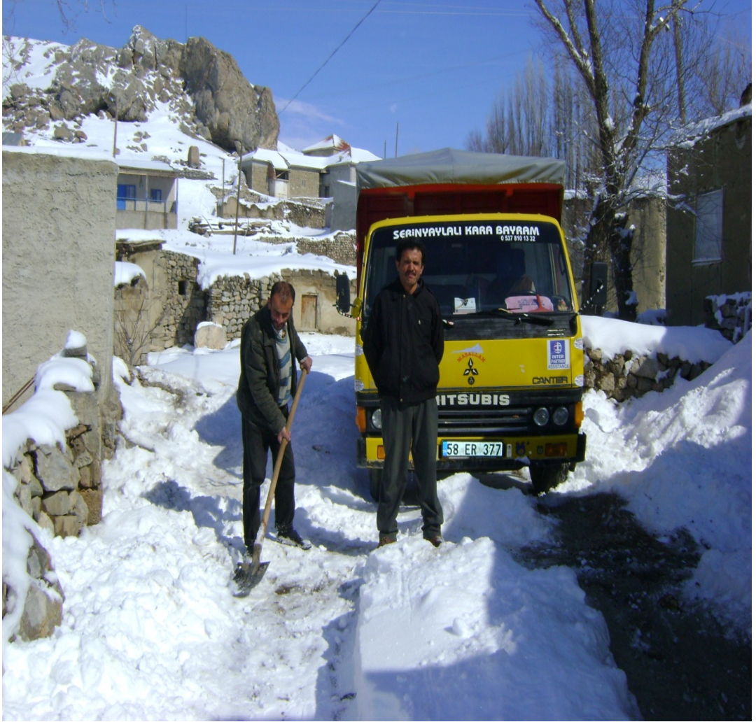
Resim 22 Soğuk Kış Aylarında Kar Yolunu Açan Bir Nakliyeciden Görünüm