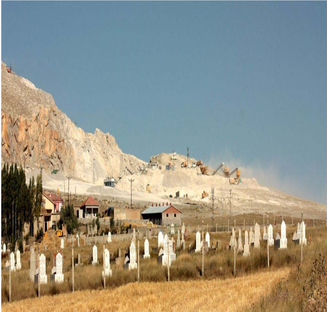
Resim 20 Köy Mezarlığından Görünüm