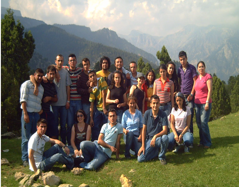
Resim 39 Serinyayla Gençlik Gezisinden Bir Görünüm/ Foto: İsmail Özer - 2008