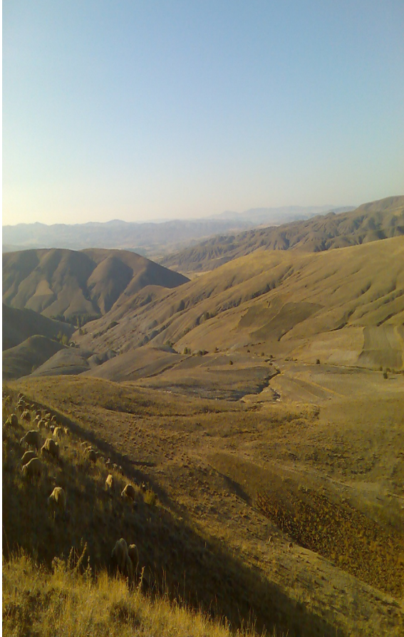
Resim 14 Yaylım Arazisi Olan Arka Kavaktan Bir görünüm