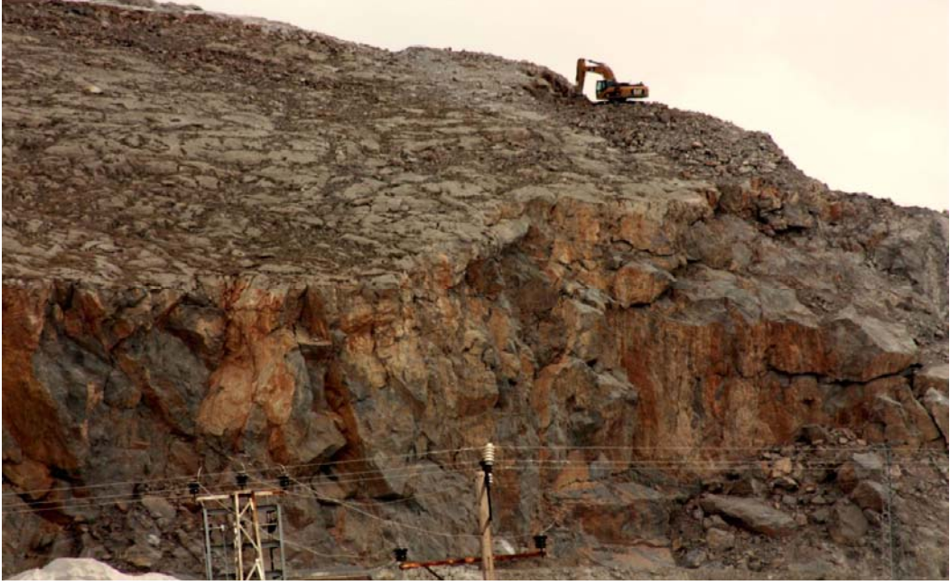
Resim 25 Boz Dede Dağının Kırılmasından Görünüm