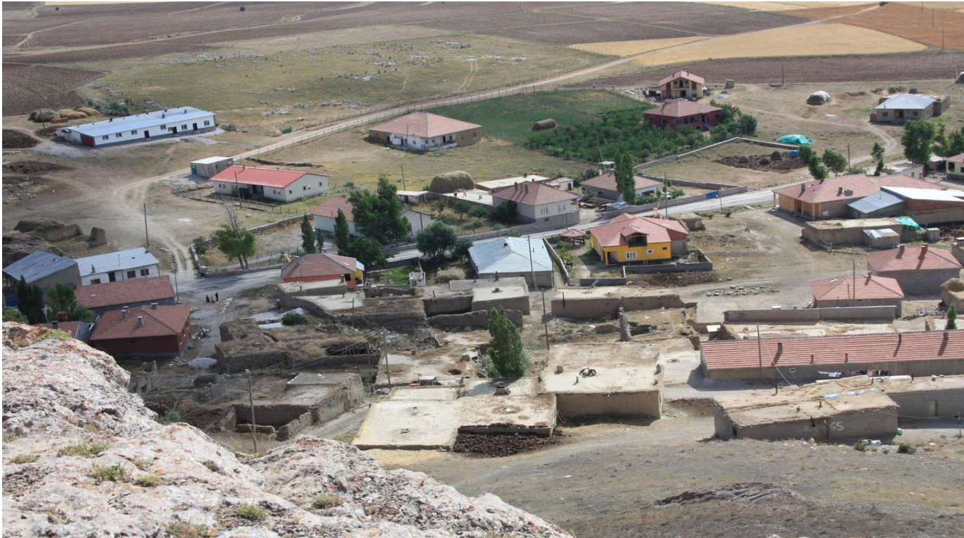
Resim 17 Köyün Aşağı Kısmından Kuş Bakışı Bir Görünüm