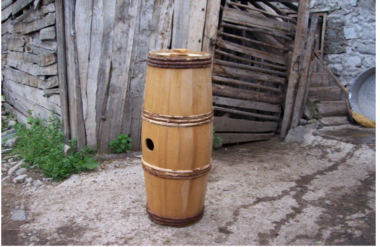
Resim 14 Köyde Kullanılan Araçlardan Birisi Olan Yayık'tan Bir Görünüm